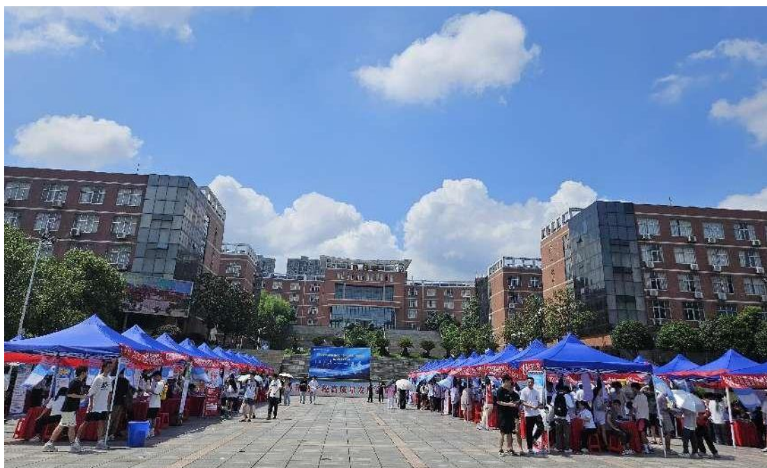
6月15日高校毕业生就业常设市场（智能制造类）双选会现场